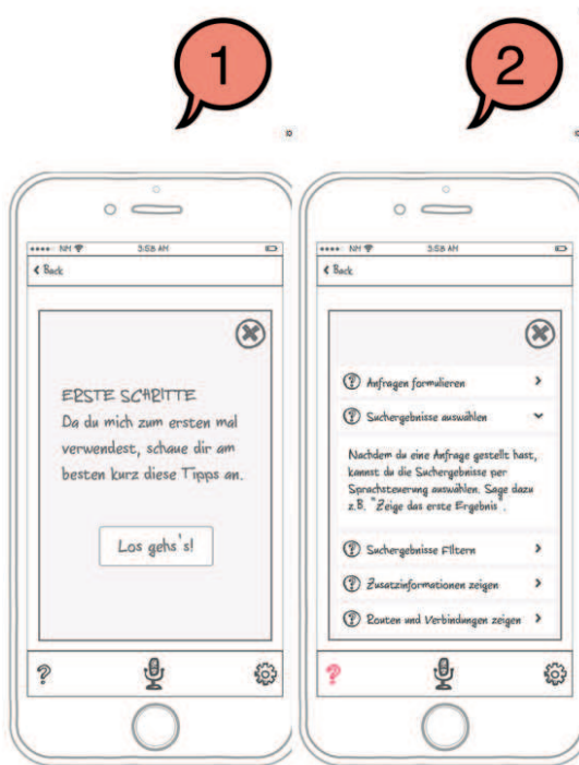
Abb. 2: Sucheinstieg innerhalb einer optimalen Voice Search [SK16]