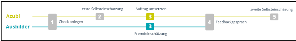
Abb. 1: Die zentralen Arbeitsschritte des KC , unterteilt in die Rollen Azubi und Ausbilder .

Im ersten Schritt legen die Nutzer der Rollen Ausbilder und Azubi gemeinsam einen konkreten Arbeitsauftrag in der Software an. Hier werden die Kompetenzen formuliert, die später beobachtet werden sollen. Ein Assistent für Kompetenzformulierungen unterstützt diesen Schritt durch Fragestellungen zum Arbeitsprozess (Abb. 2). Die Fragen basieren auf Kompetenzbausteinen aus berufsspezifischen Handlungskompetenzen und variieren pro Arbeitsprozessphase. Als Ergebnis gibt der Assistent den jeweiligen Kompetenzbaustein plus Antwort als Der Azubi kann ... - Formulierung aus (Abb. 2). Diese Kompetenzformulierungen können nun bearbeitet, gelöscht oder neu verfasst werden. Ein KC kann umfassend als Referenzarbeitsprozess zum Kopieren und Bearbeiten, oder passend zu aktuellen Aufträgen mit variierendem Kompetenzumfang angelegt werden. Empfehlenswert ist eine intensive Betrachtung ausgewählter Kompetenzen.