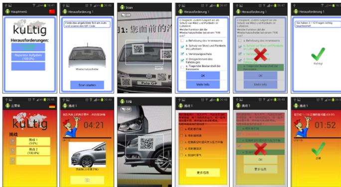
Abbildung 2: Oben: Basis Lernanwendung; unten: kulturell angepasste Lernanwendung für China

Im folgenden Abschnitt werden Gestaltungselemente (D1-5) unter Beachtung der formulierten Anforderungen (A1-5) hergeleitet. Abbildung 2 zeigt die prototypische Implementierung.