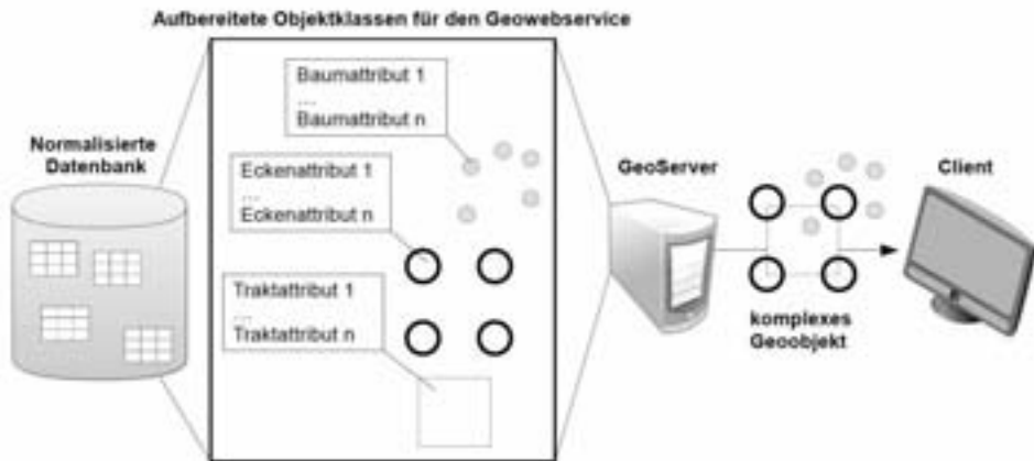
Abbildung 1: Bereitstellung eines komplexen Geoobjektes über standardisierte Geowebsservices

Zur Bereitstellung über Geowebsservices gilt es komplexe Geoobjekte (Bsp.: Aufnahmeplot der BWI) soweit wie möglich in verschiedene Objektklassen (Aufnahmeplot, Plot-ecke, Aufnahmebaum) aufzuteilen und diese geometrisch zu modellieren. Nun können jeder Objektklasse seine direkten Attribute in denormalisierter Form zugewiesen werden. Ein komplexes Geoobjekt wird so in mehrere einfach strukturierte Objekte zerlegt, welche als Layer über Geowebsservices bereitgestellt und visualisiert werden können. Diese Layer der einzelnen Objektklassen können nun von einem Geoserver wieder als Gruppenlayer zusammengeführt werden, um das komplexe Geoobjekt bereitzustellen.