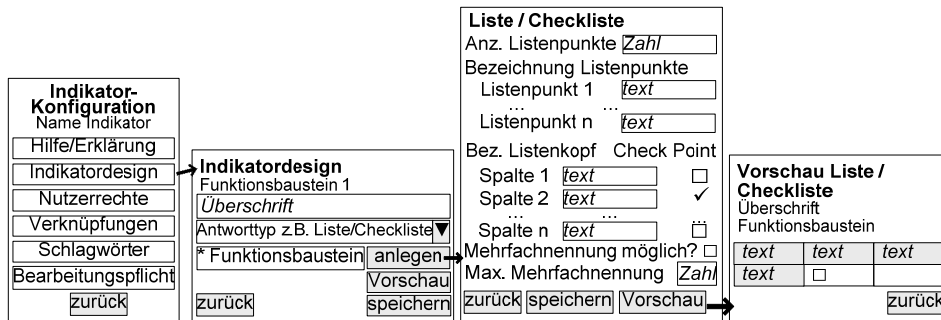
Abb. 2: Erstellung eines Indikatordesigns am Beispiel: Liste bzw. Checkliste