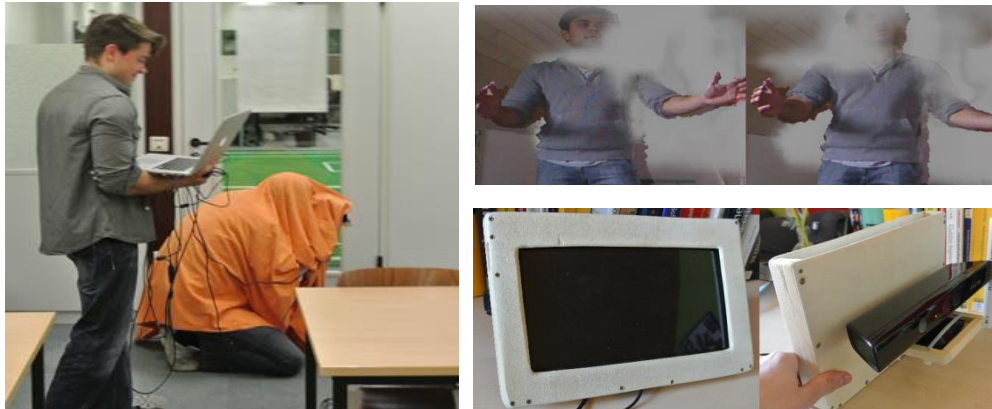
Abbildung 2: Augmented Reality (AR) + Video-See-Through Halterung