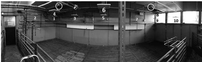
Abb. 1: Weitwinkelaufnahme der Versuchsbucht mit RFID-Antennen (1-10) und Videokameras (Kreise)

Die Versuche wurden an der Versuchsstation für Agrarwissenschaften der Universität Hohenheim durchgeführt. Der Versuchsstall für Mastschweine war mit Vollspaltenboden, einer Sensor-Kurztrogfütterung, Strohautomaten und Nippeltränken ausgestattet (Abb. 1). Über einer Bucht für 25 Tiere wurden zehn UHF-Antennen (Antu-Patch-63, Öffnungswinkel von 65^\circ/65^\circ , MTI Wireless Edge Ltd.) angebracht. Die Antennen waren höhenverstellbar, mit Strahlrichtung zum Boden an einem Holzgerüst angebracht und an drei 4-fach Multiplex-Reader (Funktionsmuster, deister electronic GmbH, Agrident GmbH) angeschlossen. Jede der Antennen war einem Sektor von 1,60 \times 1,60 m zugeordnet, so dass die Tiere in der gesamten Bucht ( 3,30 \times 7,85 m) erfasst werden konnten. Die Transponder konnten von jeder Antenne sekundlich gelesen werden. Die Bucht wurde mit zwei Videokameras (FD8154v, Vivotek Inc.) überwacht.