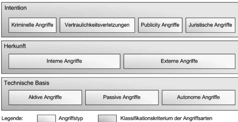
Abbildung 2: Klassifikation der Angriffe

Analog zur Klassifikation der Angreifer im vorangegangenen Kapitel gilt es auch die potentiellen Angriffsarten gegen die Telematikinfrastruktur nach geeigneten Kriterien zu systematisieren. Entscheidend für eine Unterscheidung der Angriffe können sowohl die Herkunft eines Angriffs, als auch dessen Intention und technische Basis sein. Im Folgenden werden Angriffe zuerst gemäß [Ec06] und [Ge04] nach ihrer technischen Basis und ihrer Herkunft differenziert, anschließend erfolgt eine Unterteilung nach ihrer Intention (vgl. [Sc00]). Die Klassifikation der Angriffe ist in Abbildung 2 zusammengefasst.