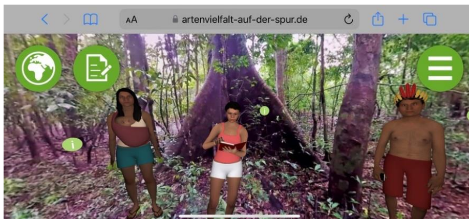
Abb. 1: Screenshot aus der greenpeace Lernanwendung zum Amazonas-Regenwald

ist, für mobile Endgeräte entwickelt. Die App ist für die beaufsichtigte Anwendung im Klassenzimmer der Jahrgangstufen sieben bis neun konzipiert und soll zum einen Wissen vermitteln, zum anderen die Relevanz der Ziele für nachhaltige Entwicklung verdeutlichen. Im Kern besteht das Lernangebot aus einer webbasierten Lösung. Flankiert wird sie durch ein Begleitmaterial mit technischen Hinweisen und didaktischen Impulsen. Nach dem Scannen eines QR-Codes mit einem mobilen Endgerät (z.B. Tablet) können die Schüler:innen virtuell an verschiedene Orte auf dem Globus reisen, welche sie im gewöhnlichen Unterricht schwer wahrnehmen können. Im Fokus dieser Studie steht nur ein Teil der greenpeace Anwendung, nämlich die virtuelle Darstellung des Amazonas-Regenwaldes. Letztere Welt ist durch auditive (z.B. Geräusche des Regenwaldes) und visuelle Inhalte (z.B. intakter vs. nicht-intakter Regenwald) geprägt und kann von den Schüler:innen frei erkundet werden. Verschiedene Interaktionen mit virtuellen Agenten (z.B. einheimische Tiere) sind möglich. Einen Eindruck bietet Abbildung 1. Innerhalb der Umgebung sind Informationen zur Lebenswirklichkeit im Regenwald eingebunden.