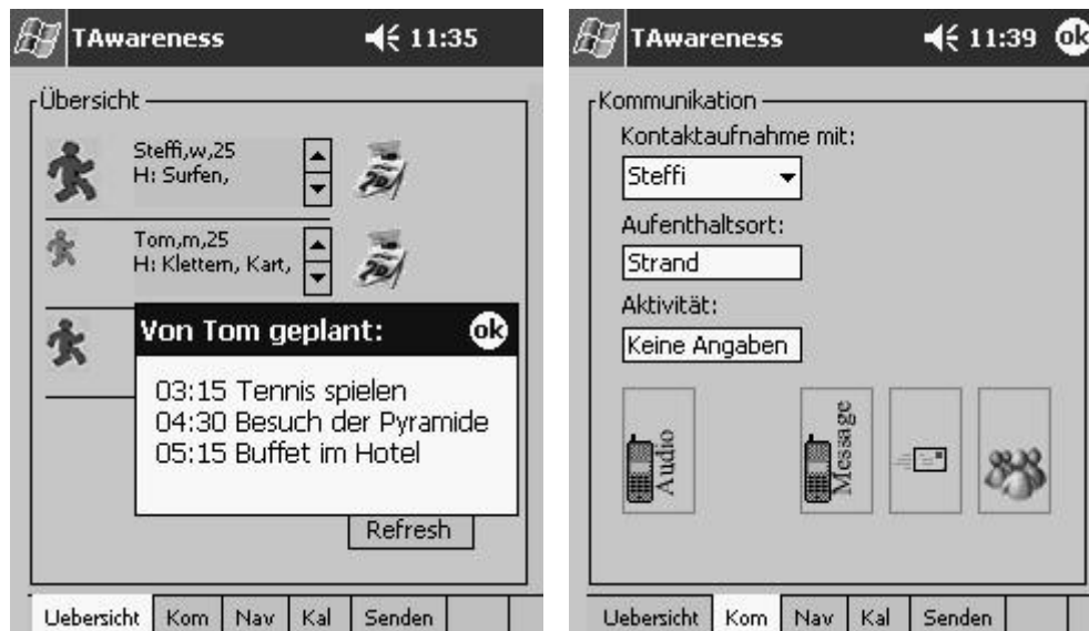
Abbildung 2: Startbildschirm mit eingeblendetem Kalender Abbildung 3: Kontextbestimmte Kommunikationsmöglichkeiten

Mittels eines extra Navigationsbereichs ist es dem Nutzer ferner möglich, anhand der vorliegenden GPS Informationen zum anderen Community-Mitglied navigiert zu werden. Dabei werden sowohl Richtung, als auch die Entfernung angegeben. Auf die Integration weitergehender Navigationssysteme oder einer Landkarte, wie sie der Mobile Communities Prototyp von Tasch und Brakel (2004) benutzt, wurde an dieser Stelle verzichtet, da diese in komplett fremden Gebieten oftmals nur begrenzten Nutzen haben und zudem ihre globale Verfügbarkeit nicht sichergestellt werden kann. In einem weiteren Tab kann der Nutzer Angaben zu seiner aktuellen Aktivität machen und geplante Termine eingeben. Diese werden dann an den Server übermittelt, wobei der Nutzer jederzeit die Möglichkeit hat, den eigenen Standort zu unterdrücken und Kommunikationskanäle zu öffnen oder zu schließen.