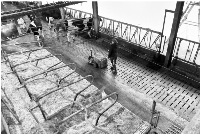
Abb. 1: Verwendetes Stallabteil ohne Tierpräsenz zur Evaluation des Funktionsmusters des Tracking-Referenzsystems (hier ist die Durchführung der dynamischen Messreihen zu sehen)

Zur Evaluierung des Funktionsmusters als Tracking-Referenzsystem wurden statische und dynamische Positionsmessungen in einem Stallabteil des Milchviehstalls des Versuchs- und Bildungszentrum Landwirtschaft Haus Düsse ohne Tierpräsenz durchgeführt (vgl. Abb. 1).