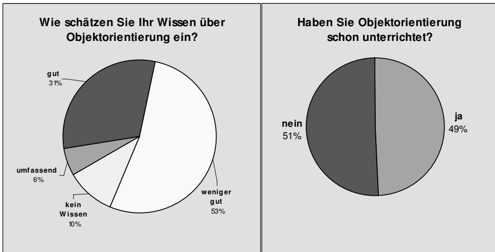
Abbildung 2: Selbsteinschätzung und Unterrichtserfahrungen. Gesamtbetrachtung Berlin/Brandenburg/Thüringen. (n=69)