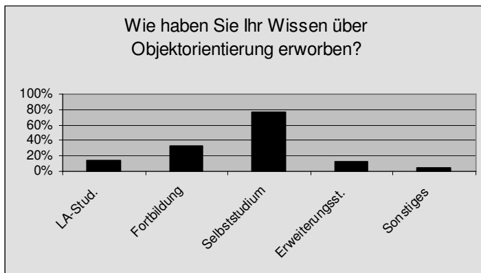
Abbildung 1: Wissenserwerb. Gesamtbetrachtung Berlin/Brandenburg/Thüringen. (n=69)

Zusätzlich müssen mindestens zwei Veranstaltungen in der Didaktik der Informatik belegt werden. Mit der Objektorientierten Sichtweise kommen Lehramtsstudenten im Studium allerdings nur selten in Berührung: Verpflichtend nur kurz in der einführenden Veranstaltung „Rechner- und Netzbetrieb“. Wahlweise können die Veranstaltung „Grundlagen der Softwareentwicklung“ sowie weitere Veranstaltungen aus diesem Bereich belegt werden. Aufgrund einer hohen Arbeitsbelastung geschieht das allerdings nur selten.