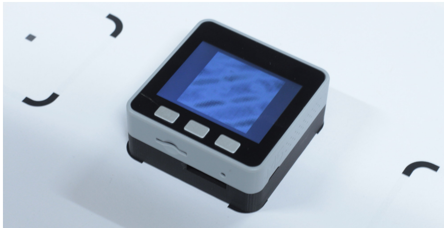
Abbildung 1: DotTrack erlaubt es, die Position eines Tangibles auf einer Oberfläche ohne externe Tracking-Infrastruktur zu tracken. Der Prototyp basiert auf einem M5Stack -Entwicklerboard und einem PMW3360DM -Sensor

Zum Tracking der Objekte werden üblicherweise elektromagnetische oder optische Trackingverfahren oder interaktive Tische mit kapazitiven oder optischen Touchscreens verwendet. Alle diese Verfahren erfordern eine externe Tracking-Infrastruktur, die oft teuer und schlecht transportabel ist. Diese Abhängigkeit von zusätzlicher Hardware erschwert den mobilen Einsatz zum Beispiel in Kindergärten, Schulen oder im Alltag.