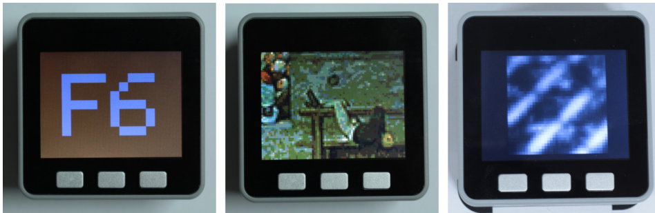
Abbildung 3: Demo-Anwendungen: Selektion von Werten über Verschieben des Tangibles, Suche in einem Wimmelbild mit dem Tangible als Magic Lens , Live-Anzeige des Rohbilds des Maussensors

bereits verschiedene Vorschläge dafür, wie Tracking-Muster zur eindeutigen Ortsbestimmung algorithmisch generiert werden können (Bruckstein u. a. 2012; Hostettler u. a. 2016). Wir planen, auf diesen Arbeiten aufzubauen.