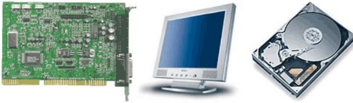
Abbildung 4: Zufällige Anordnung von Bildern

Im folgenden kurzen, aber gehaltvollen und leistungsfähigen serverseitigen HTML-PHP-Skript ist der SHUFFLE-Befehl als PHP-Bibliotheksfunktion nicht zu übersehen: