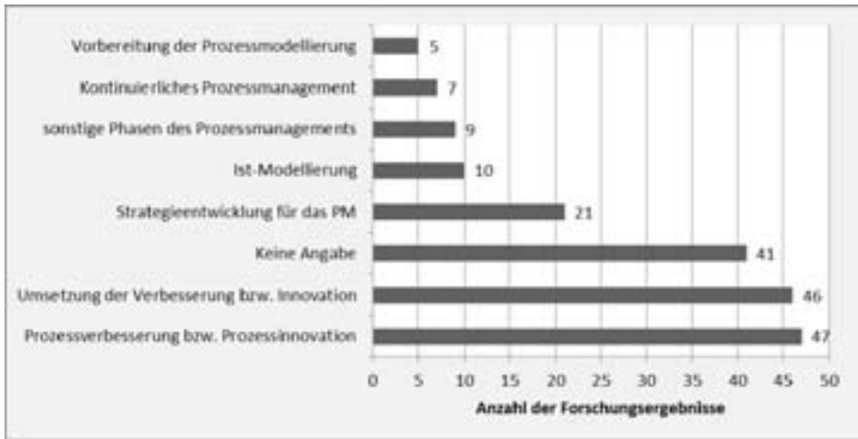
Abbildung 2: Phasen des Prozessmanagements

Im Bereich des Prozessmanagements werden vor allem Prozessverbesserungen und Umsetzungen erarbeitet. Die Strategieentwicklung sowie auch das kontinuierliche Prozessmanagement werden in den erfassten Forschungsergebnissen kaum betrachtet (vgl. Abbildung 2).