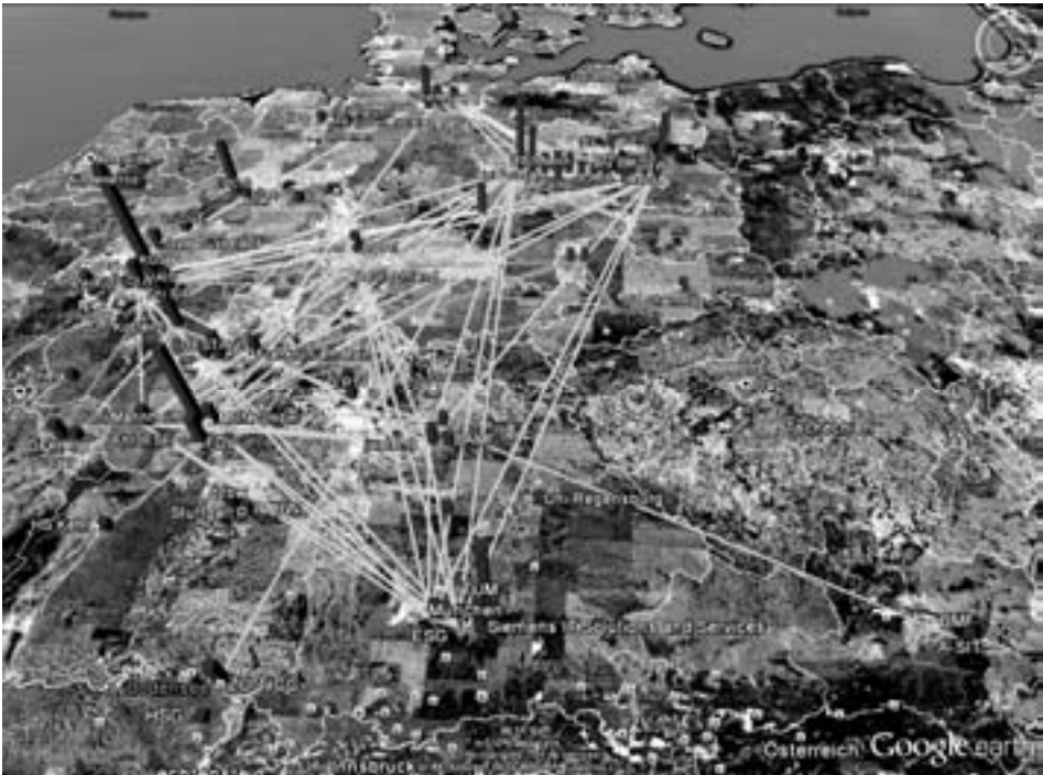
Abbildung 1: Geographische Darstellung der institutionellen Vernetzung

Die geographische Auswertung lässt sich durch eine Darstellung der Vernetzung der Forschungslandschaft in der prozessorientierten Verwaltung ergänzen (Abbildung 1). Der Großteil der 285 Verknüpfungen besteht aus schwachen Kooperationen, das heißt Institutionen, die über maximal zwei Forschungsergebnisse miteinander kooperieren. Die Intensität der Vernetzung von Forschungsinstitutionen der prozessorientierten Verwaltung kann dementsprechend als eher gering eingeschätzt werden.