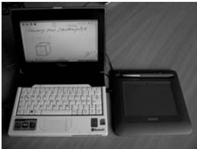
Abbildung 2: Persönlicher Schülerarbeitsplatz mit AMILO-Mini und Graphiktablett

Wichtig ist dabei, dass die gesamte Klasse mit einer homogenen Hardware und einer homogenen Basissoftware ausgestattet ist. Im Rahmen des von uns derzeit durchgeführten Projektes kommen die AMILO-Mini-Netbooks zum Einsatz. Zur Erweiterung der Eingabemöglichkeiten sind die Computer mit Wacom Bamboo-Graphiktablets ausgestattet. Jeder Lehrer sollte über ein leistungsfähiges Notebook, bezogen auf die Verwendung einer interaktiven Tafel, möglichst einen Tablet-PC, verfügen. Die im Projekt verwendete Hardware, Netbook und Graphiktablett wird von den Autoren als nicht optimal eingeschätzt, war aber im Rahmen der Initiative vorgegeben. Als geeigneter wird ein derzeit in der Entwicklung befindliches Notebook mit Tabletfunktion (convertible classmate PC) [CM09] beurteilt.