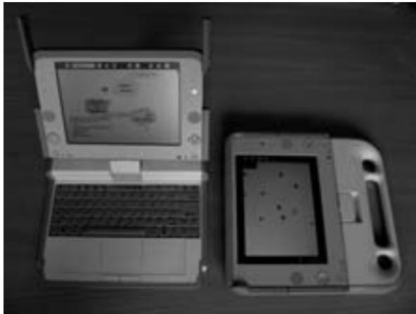
Abbildung 1: XO - Computer

Damit ist der XO ein Computer, der als Medium im Unterricht Lehrbücher ersetzen und ergänzen kann, das kooperative Arbeiten untereinander unterstützt, als Kommunikationsmittel dient und den Zugang zum Internet ermöglichen kann. Die vorinstallierten Aktivitäten unterstützen das Lernen in verschiedenen Unterrichtsfächern. Mit der integrierten Kamera können Bilder für multimediale Applikationen erfasst werden. Der XO kann als Computer in der informatischen Grundbildung eingesetzt werden. Aktivitäten, die eine erste Erstellung von Programmen in unterschiedlicher Form ermöglichen sind z.B. Etoys, Scratch und Python. Die Aktivität Etoys stellt einen umfangreichen Medienbaukasten zur Verfügung, mit dem die Kinder ihre Ideen umsetzen können, indem sie Geschichten visualisieren und animieren.