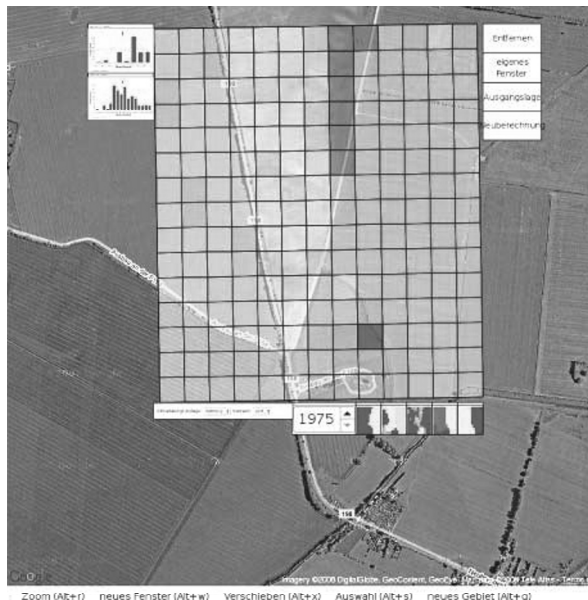
Abbildung 2: Grundwasserneubildung in einem Gebiet nahe Prenzlau