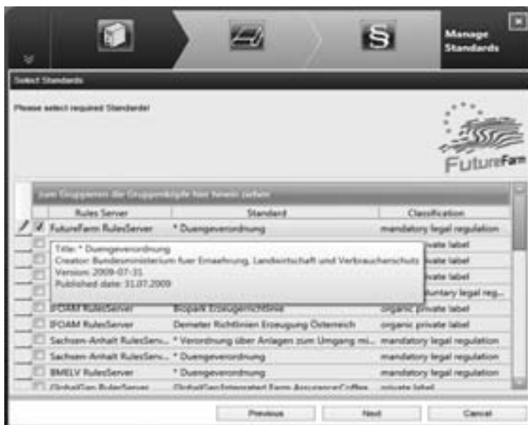
Abbildung 3: Darstellung der Auswahl verschiedener Vorschriftensätze unterschiedlicher Vorschriften-Server innerhalb des FMIS AGRO-NET