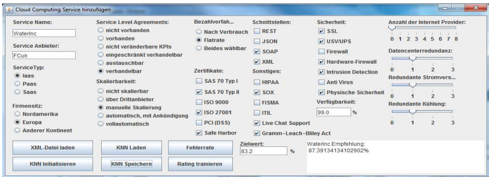
Abbildung 4: GUI zum KNN

www.uwi.uni-osnabrueck.de/klassendiagramm.pdf. Die Klasse CCS_attributes dient zum Auslesen der Bewertungsmerkmale sowie zur Repräsentation der Merkmalsvektoren in XML (vgl. Abbildung 3). Mit Hilfe der Klasse CloudGUI wird das GUI erzeugt (vgl. Abbildung 4). Die Klasse DBtransfer dient zum Speichern und Laden der Merkmalsvektoren. Die Klasse Codierung unterstützt die Codierung und Transformation der Merkmalswerte als binäre Werte sowie als kontinuierliche Werte im Intervall [0,1]. Die Klasse initNeuro erzeugt ein KNN zum Trainieren und Testen. Die Klasse WebAPI wird schließlich zur Initialisierung des GUI benötigt. Abbildung 4 zeigt das GUI zum KNN. Der Anwender hat über das GUI die Möglichkeiten KNN zu erstellen, zu trainieren und zu testen, Fehlerraten zu prüfen sowie die entsprechenden Merkmale eines Cloud Computing Services einzutragen, zu dem eine Empfehlung abgegeben werden soll.