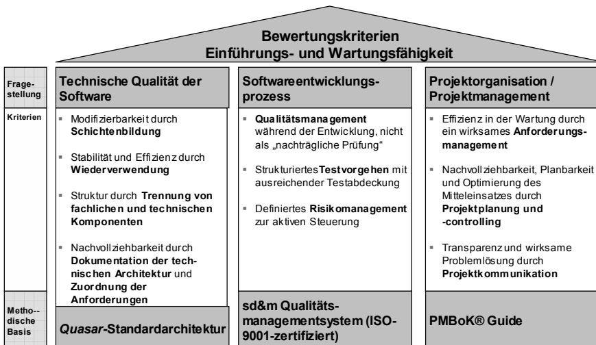
Abbildung 3 Bewertungskriterien ergeben sich aus den Teilaspekten aller Kategorien

Abbildung 3 stellt die Bewertungskriterien der Einführungs- und Wartungsfähigkeit einer Anwendung dar. Diese wurden aus der konkreten Fragestellung, über die Spiegelung gegen die relevanten Standards und durch Festlegung konkreter Kriterien nach den ersten Eindrücken in Gesprächen mit dem Auftraggeber und dem Projektteam festgelegt.