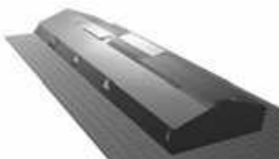
Abb. 2: GWH-Modell in ProdIS-Plant

In puncto CFD-Software gibt es verschiedene Lösungen. Neben kommerziellen Produkten steht hier OpenFOAM® zur Verfügung, eine Sammlung von Open Source-Bibliotheken, die über gut dokumentierte Skripten konfigurierbar sind. Vorteile dieses Pakets sind zum einen die Offenheit, wodurch die Programmierung eines Interface zu anderen Programmen erst möglich wird, zum anderen die kostenlose Verfügbarkeit. Abb. 3 stellt beispielhaft eine Momentaufnahme der mit OpenFOAM® berechneten Konvektion in einem Gewächshaus unter Annahme einer kalten Hülle und eines warmen Bodens dar.