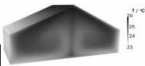
Abb. 3: Konvektion in OpenFOAM

Ein Schwerpunkt von CFD-Simulationen des Gewächshausklimas wird in Zukunft auf dem Energiehaushalt liegen. Da allerdings eine energetische Betrachtung des Gesamtsystems nur unter Einbeziehung der Pflanze Sinn macht, muss darüber nachgedacht werden, wie ein Pflanzenbestand in diesem Kontext am besten modelliert wird und auf welche Weise die bestehende Datenstruktur erweitert werden muss.