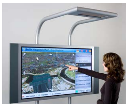
Abb. 2: Aufbau des Testsystems mit einem 63" Plasmabildschirm und dem HHI Handtracker über der Hand des Nutzers.

Das Interaktionskonzept beruht dabei auf einer Metapher aus der natürlichen Umwelt, in der Objekte wie z.B. Fotos auf einem Tisch liegen. In der virtuellen Umgebung werden die Objekte auf einem Display dargestellt. Streckt der Nutzer seine(n) Finger aus, kann er auf diese Objekte - mit dem Mauszeiger - zeigen. Wird der Finger nach vorne, also in Richtung des Objektes auf dem Bildschirm bewegt, kann dieses Objekt berührt werden, genauso wie wenn man ein Objekt auf einem realen Schreibtisch berühren würde. Damit kann man das Objekt über den Tisch bewegen und wieder loslassen. Die virtuelle Berührung erfolgt, indem der Nutzer mit seinem Finger eine virtuelle Wand durchsticht und damit vom Zeige-Modus in den Greif-Modus wechselt. Diese Aktion wird durch ein auditives und visuelles Feedback unterstützt.