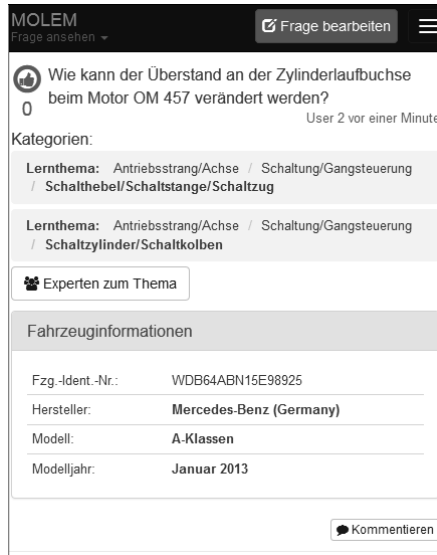
Abb. 2: Anzeige eine Frage mit Möglichkeit Kontaktdaten von Experten anzuzeigen

der Fragestellung kompetenten Nutzer in vier Schritten: