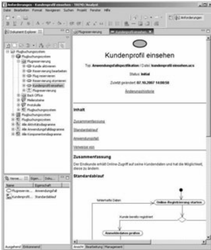
Abbildung 2: Beispiel für ein Anforderungsdokument (Use Case Spezifikation)

geprüft, ob ein Dokument bereits vollständig ist, der Benutzer bekommt einen entsprechenden Hinweis. Ein Dokument ist erst dann vollständig, wenn alle obligatorischen Eigenschaften mit Werten versehen wurden. Auch die referenzielle Integrität wird überprüft. Sollen z.B. noch verwendete Artefakte gelöscht werden, wird der Benutzer gewarnt.